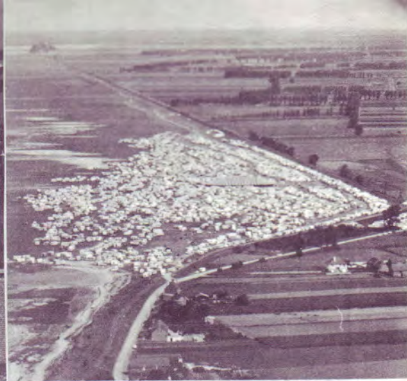
Vue du rassemblement autour du chapiteau. Dans le lointain, on distingue le Mont St-Michel.