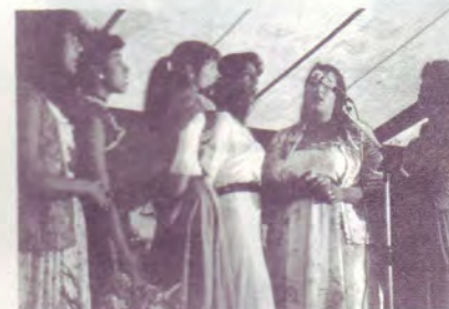
Chants des Roms