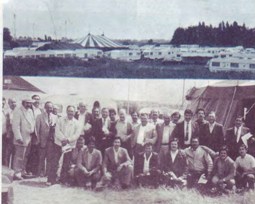
Prédicateurs des différents groupes des Roms.

Peu après, alors que les caravanes arrivaient d'Allemagne et s'arrê-