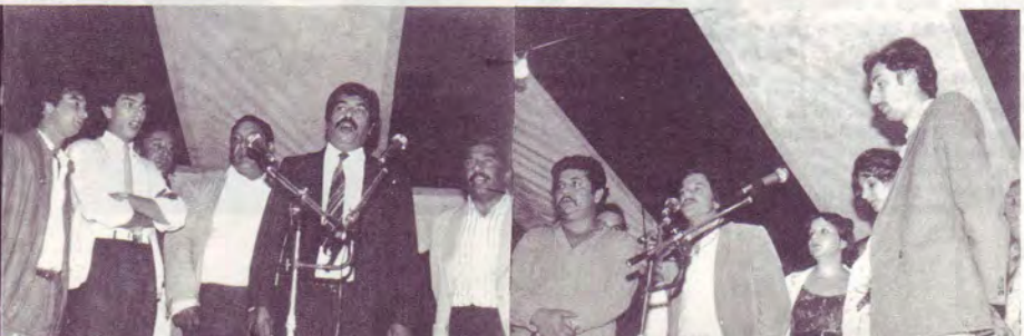
Roms de Suède