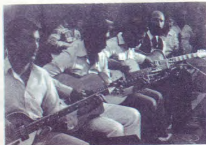
Musiciens de Hollande