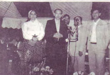
Roms de Roumanie