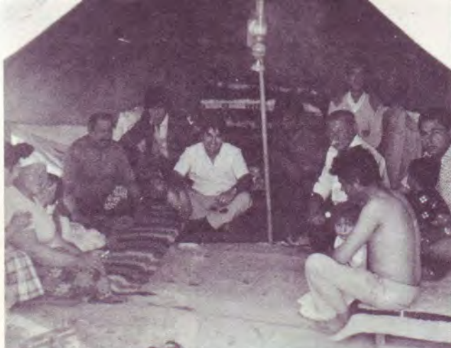
Rencontre avec les tziganes, sous leur tente