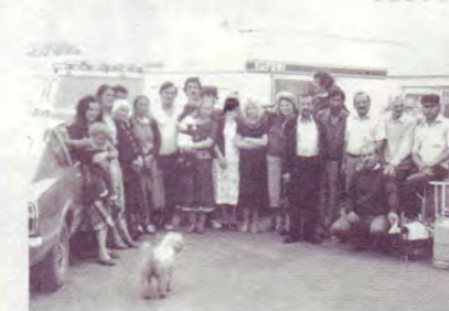
Une famille de voyageurs récemment convertie