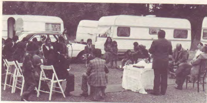
Culte en plein-air et réunion d'enfants Roms.