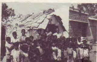
L'une de nos écoles en Inde.