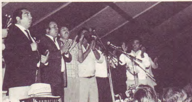
Gitanos d'Espagne à la 3 e Convention Mondiale.

Au Portugal, pendant plusieurs années l'œuvre a évolué lentement et avec difficulté. Aujourd'hui une œuvre puissante de Dieu se fait au Portugal. Le puissant réveil qu'à connu l'Espagne commence à s'y manifester. La différence qui existe entre les gitanos portugais et les gitanos espagnols est surtout dû à l'évolution de la société. Il y a trente ans de différence entre le mode de vie des gitanos de ces deux pays.