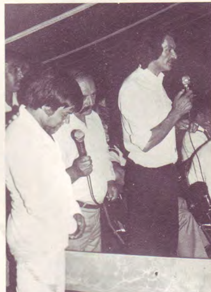
Un frère témoigne avant son baptême

Sur un très beau terrain situé près de la gare, des caravanes de tziganes venus de France, d'Allemagne, de Belgique, de Hollande s'étaient groupés autour du grand chapiteau. Les messages furent parfois traduits du Français en Hollandais par le pasteur Van Amerom, président des Assemblées de Dieu de Hollande. Les réunions furent bénies et les prédicateurs furent fortifiés dans leur ministère par les bonnes exhortations du pasteur Raper d'Afrique du Sud invité à cette convention comme principal orateur. Un service de baptêmes eut lieu le dimanche. La convention était organisée par le prédicateur Reinhardt Néné, président de la Mission Evangélique Tzigane de Hollande.