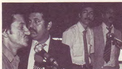
Roms de Suède.

Cette convention fut une réussite et un départ vers une action d'évangélisation plus intense parmi ce peuple de plus de 10 millions d'âmes dispersées dans les nations.