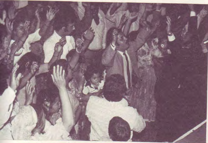
Intercession des roms pour la guérison des malades.