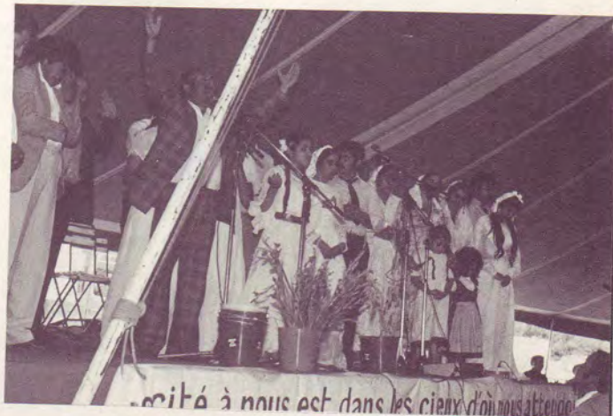
La Convention - Les nouveaux baptisés roms.