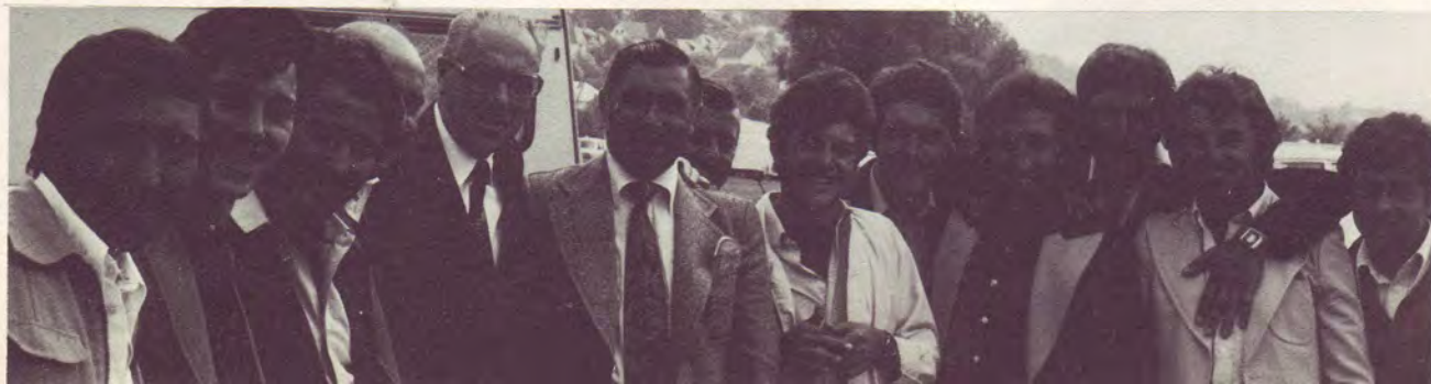
Groupes de jeunes roms.