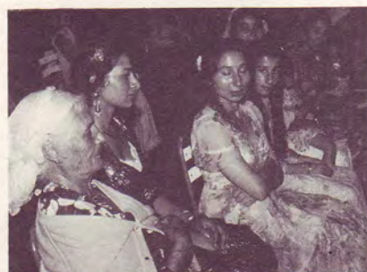
Femmes Roms - France et Allemagne.