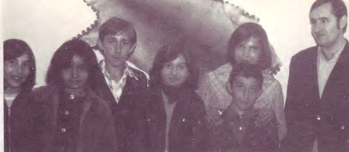
Quelques enfants Tziganes de la chorale de l'Eglise Réformée et leur pasteur. — en Hongrie —

En Hongrie il semble qu'il y ait plus de liberté. Un pasteur