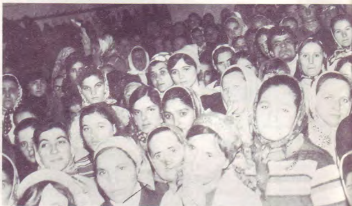
Vue partielle de l'auditoire de 500 personnes de l'église tzigane de Tisisoara.

Longtemps privées de Bibles et de conducteurs spirituels affermis dans la connaissance doctrinale de l'Écriture, livrées à elles-mêmes, de nombreuses communautés ont donné une très large place aux manifestations des dons de l'Esprit au cours des réunions de groupes dans les maisons, s'appuyant sur 1 Corinthiens 14 : 26. Mais peut-être est-ce là aussi l'une des raisons de la croissance numérique plus rapide qu'en France puisque l'on y compte 150.000 chrétiens de pentecôte contre 50.000 en France (y compris 20.000 Tziganes) et pour un pays deux fois moins peuplé.