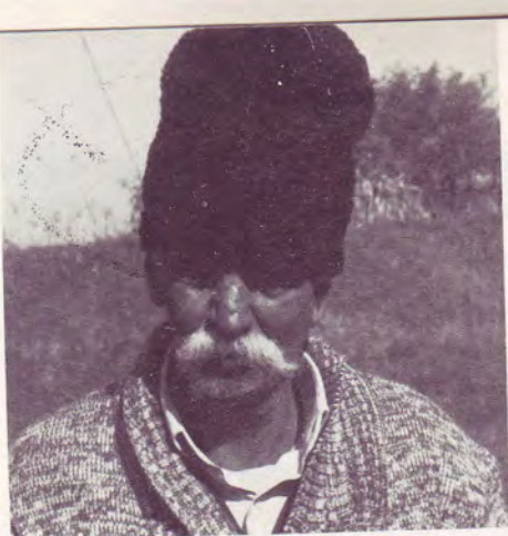
Roms de Roumanie