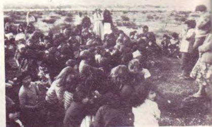
Un petit témoin à la réunion des enfants.