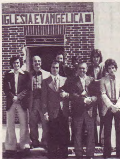
Le pasteur et ses jeunes collaborateurs de Pan Bendito à Madrid

C'est une église vivante dont le tonus spirituel n'a pas baissé au cours des années. C'est une communauté conquérante dont le nombre de membres ne cesse de croître. C'est pourquoi les chrétiens de Pan Bendito cherchent un autre local pour s'y établir, l'actuel est maintenant bien trop petit.