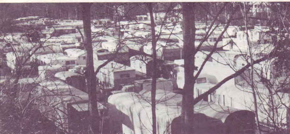
Ghetto des voyageurs en Suisse, un terrain inadéquat à Versoix près Genève

Nevers, etc. Cependant, les Prédicateurs Gitans rencontrèrent beaucoup de difficultés à travailler de cette façon. Il fallait tout d'abord obtenir les autorisations municipales pour le stationnement des caravanes, et l'emplacement de la tente, et, malheu-