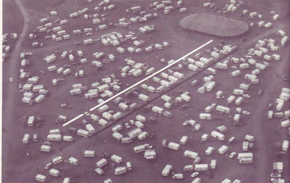
Vue aérienne de la Convention de Nantes. Vous distinguez dans le Centre le titre de notre mission « VIE ET LUMIERE » composé par les caravanes. On distingue le grand chapiteau bleu et la tente de prières « bleue et blanche ».

Il y eut renouveau de zèle dans la prière. La remise en route de la « chaîne de prière », 24 heures sur 24 a été source de bénédictions : guérisons, baptêmes dans le Saint-Esprit, vies transformées, délivrances de vices et de passions.