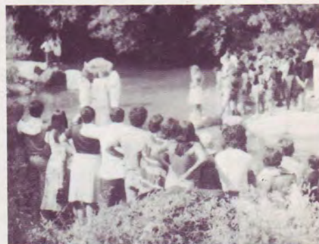
Frère de Manolo