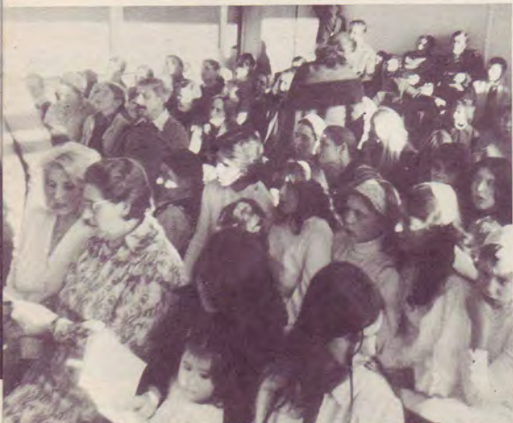
partie de l'auditoire