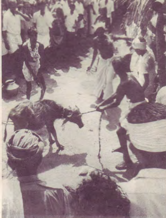
Photo : Sacrifice d'un buffle au " dieu " hindou, telle est l'une des pratiques des tziganes païens qui ne connaissent pas Jésus-Christ. Notre devoir est de leur annoncer la " bonne nouvelle ". Pour cela nous soutenons régulièrement 12 prédicateurs en Inde, par votre participation à cette œuvre missionnaire.