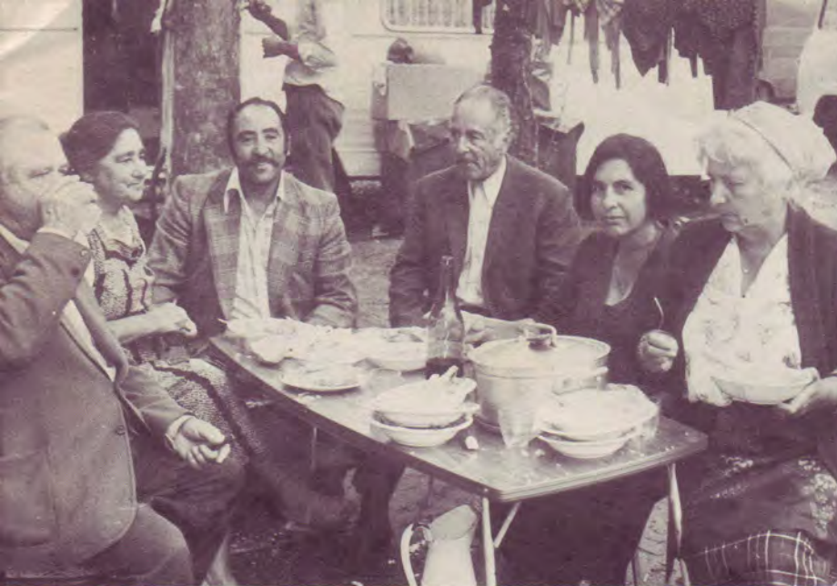
En famille - Sœur " Vévette " à droite