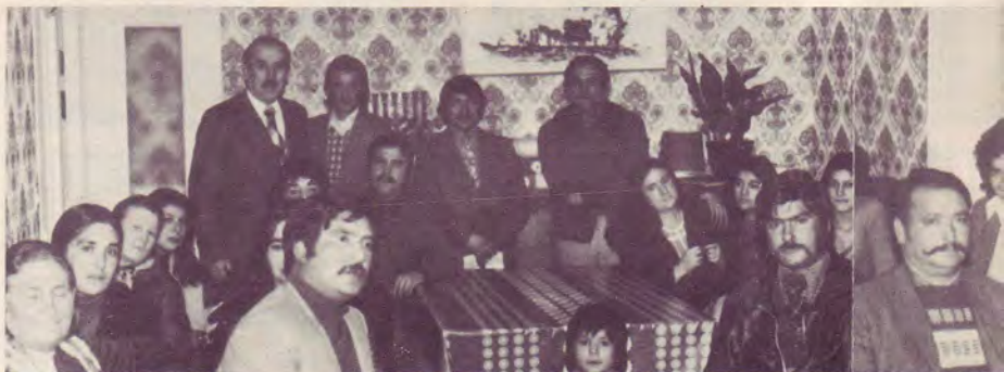
Réunion au Mans