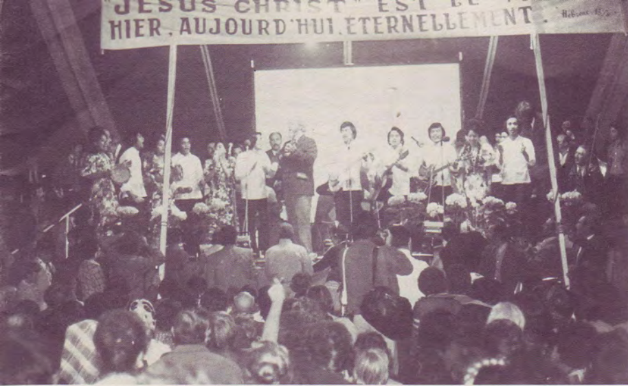
Les Philippins chantent