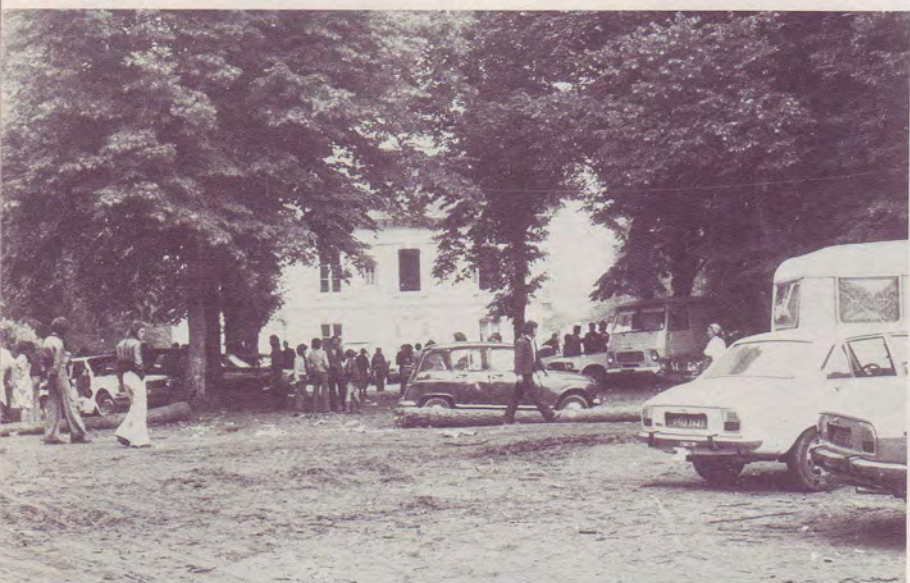
Le Nouveau Centre - Au fond l'Ecole Biblique