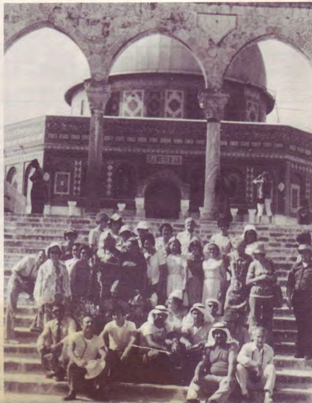
Le groupe devant la mosquée d'Omar à Jérusalem