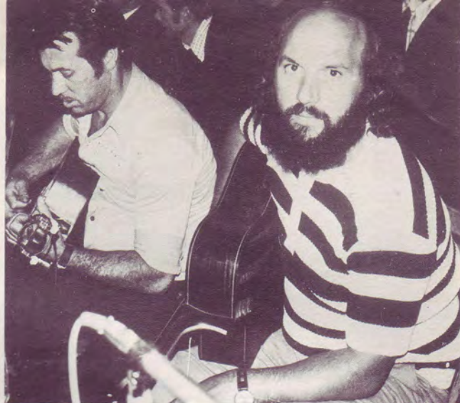
frères mucisiens de Hollande