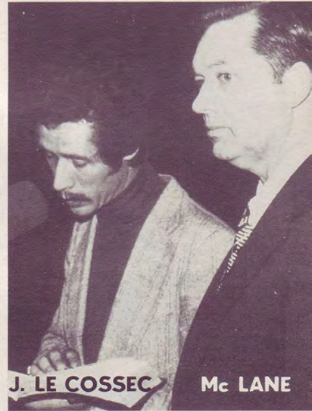
J. LE COSSEC