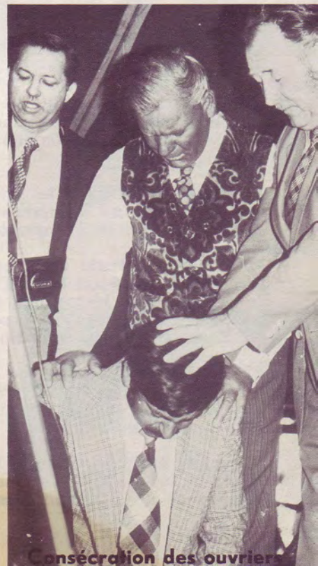
Consécration des ouvriers