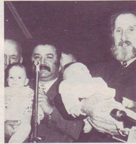
Baptêmes dans l'eau