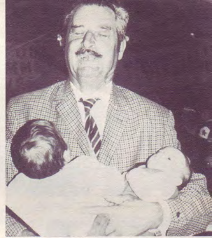
Présentation des enfants