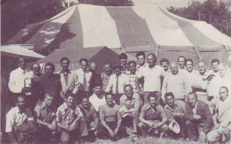
Les responsables nationaux de divers pays