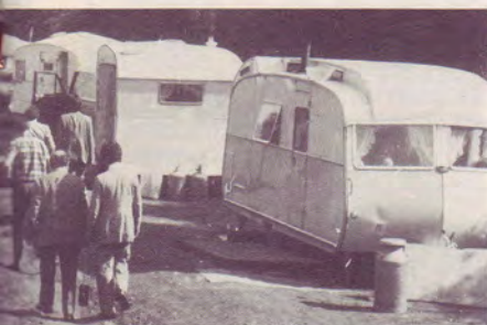
Mission au Pays de Galles