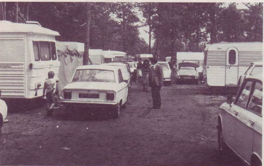
Une des allées de la propriété de 30 hectares