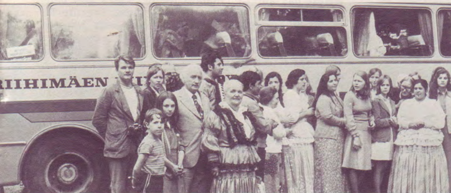
Frères et sœurs tziganes de Finlande