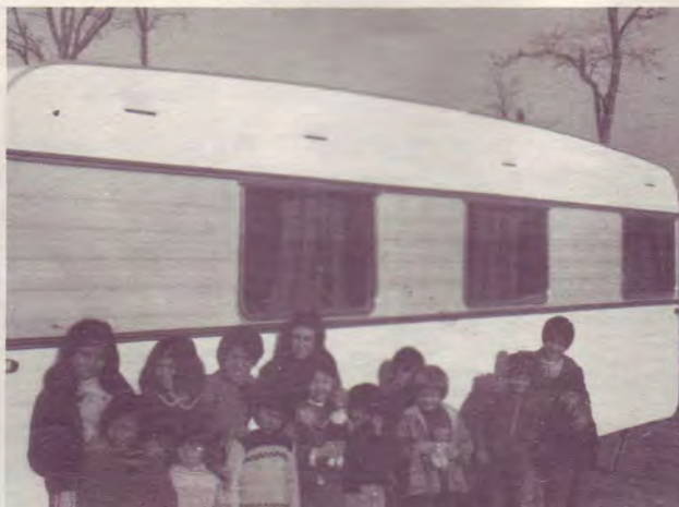
Les élèves devant leur école roulante

Le feu divin a aussi atteint les enfants, et personnellement je considère cela comme la marque la plus authentique de ce réveil, limité il est vrai en étendue, mais pas en profondeur. Ils ont été baptisés dans le Saint Esprit, avec les signes suivants : parler en langues, interprétation, prophétie, visions, don d'exhortation. Voici un exemple de vision donnée par un enfant, parmi tant d'autres : l'enfant voit le globe terrestre et les étoiles, et sur le côté un marteau. Ce marteau se lève et frappe la terre qui éclate, le ciel aussi disparaît et seul le marteau reste. L'interprétation en est aisée par la Parole