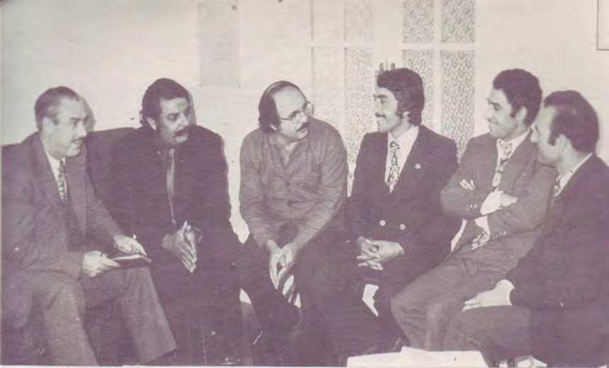
Entretien avec le Conseil de Direction de la Mission Evangélique Gitane d'Espagne