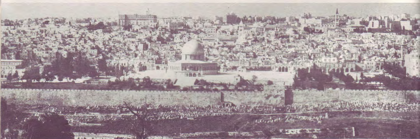
JERUSALEM aujourd'hui - Au centre, la Mosquée d'OMAR à l'emplacement du Temple

cun de ces rassemblements dans la marche chronologique des événements, la révélation apparaît alors simple, facile à comprendre.