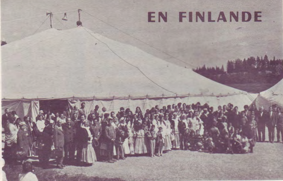
Lors de la convention : Juin 1973

Pays de lacs et de bois, la Finlande a aussi ses tziganes. Ils sont au nombre de 5 000 environ, et parmi eux on compte près de 300 convertis au Seigneur. Ils sont conduits par huit prédicateurs tziganes dont l'un a été récemment désigné comme leur président.