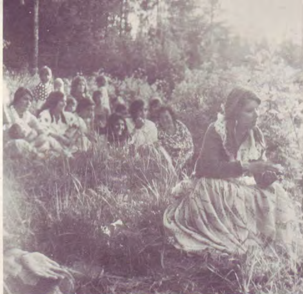
Réunion en plein air

J'ai été très bas, aussi bas que possible. Le diable ne voulait pas laisser partir son vieux serviteur si facilement que cela. Il me tenait lié jusqu'au moment où le Seigneur qui m'appelait de différentes manières m'attira à Lui. Et c'est dans le sang précieux de Jésus que tous les liens du péché qui m'enveloppaient ont été rompus.