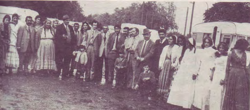
Une partie du groupe des Roms