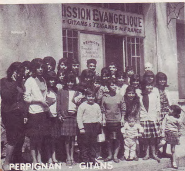
PERPIGNAN - GITANS