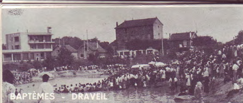
BAPTÊMES - DRAVEIL