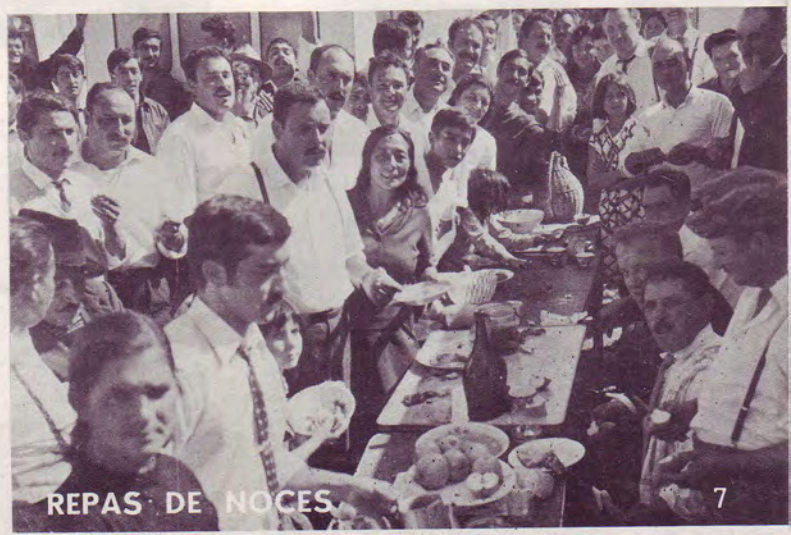
REPAS DE NOCES