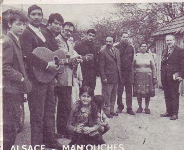
ALSACE - MAN'OUCHES