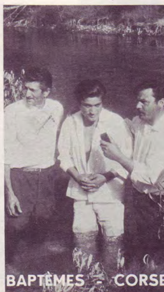
BAPTÊMES - CORSE