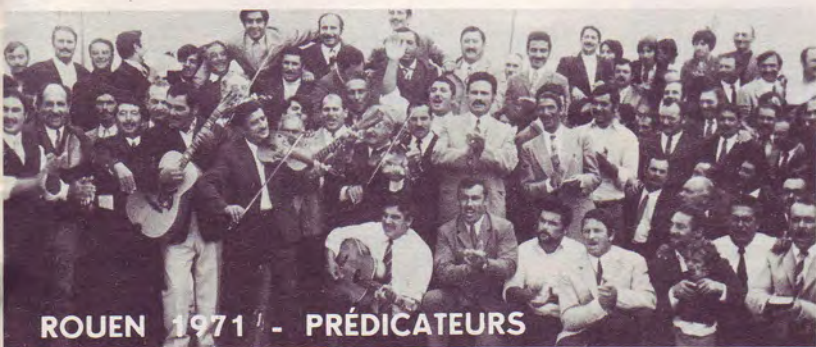
ROUEN 1971 - PRÉDICATEURS