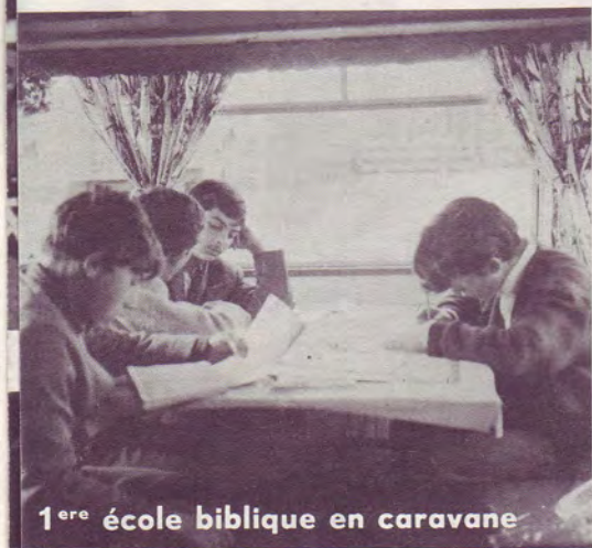
1 ère école biblique en caravane