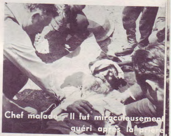
Chef malade - Il fut miraculeusement guéri après la prière