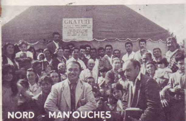
NORD - MAN'OUCHES