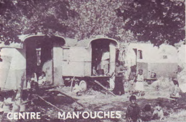
CENTRE - MAN'OUCHES