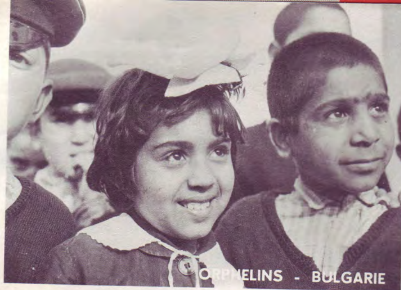
ORPHELINS - BULGARIE