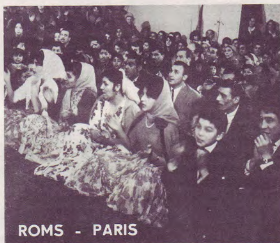
ROMS - PARIS