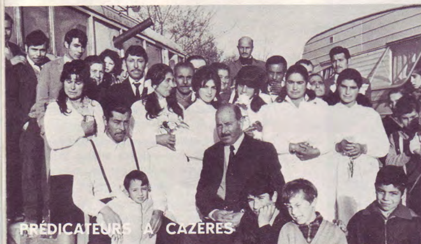
PRÉDICATEURS A CAZÈRES