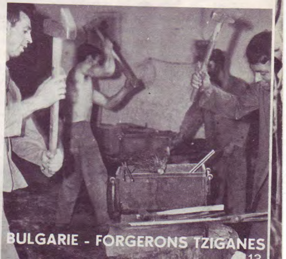
BULGARIE - FORGERONS TZIGANES