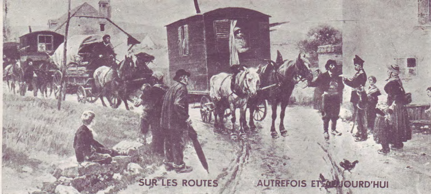
SUR LES ROUTES