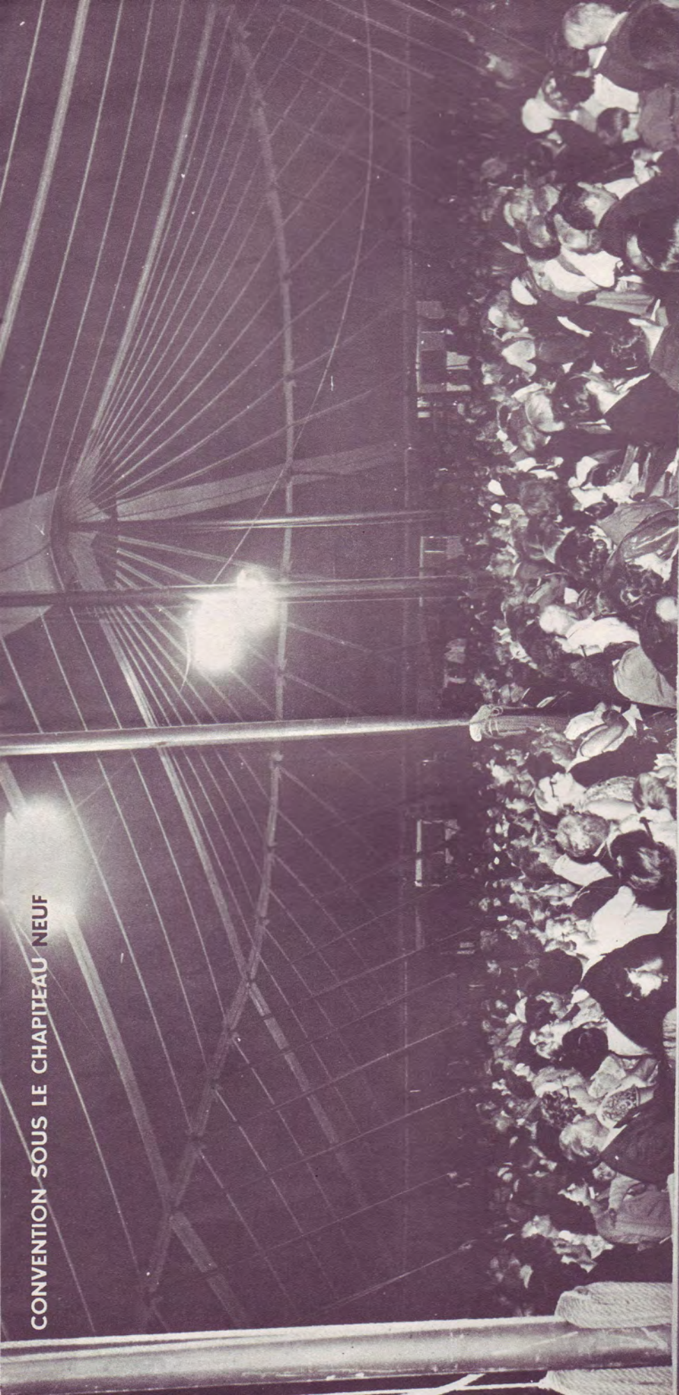
CONVENTION SOUS LE CHAPITEAU NEUF