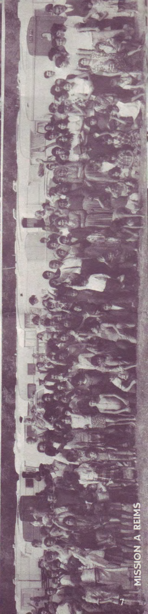
MISSION A REIMS