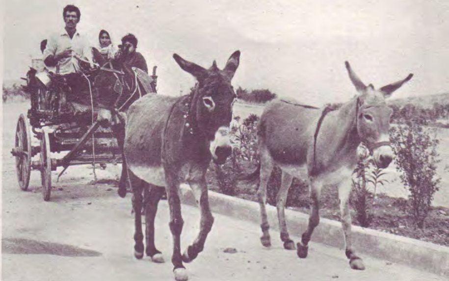
Sur les routes de Grèce avec les Gitans