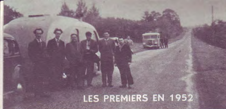
LES PREMIERS EN 1952