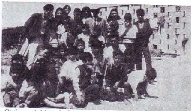
Quelques chrétiens de l'Assemblée de Dieu Tzigane de Montpellier. A l'arrière-plan : le lieu de culte.