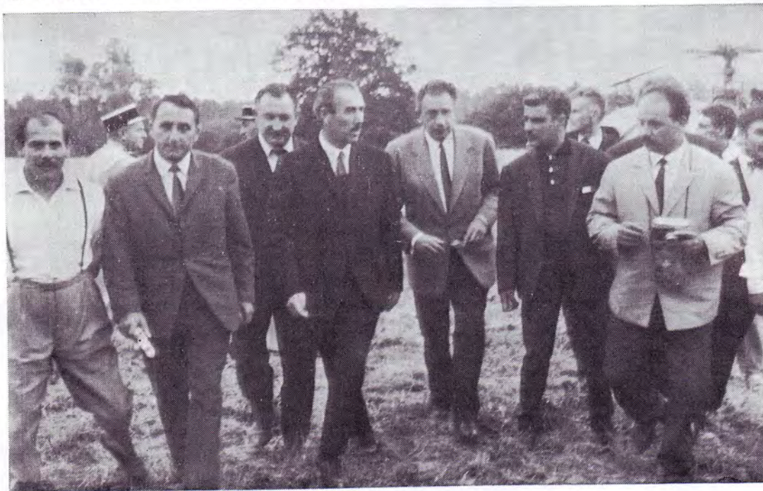
Arrivée de M. le Préfet et de M. le Sous-Préfet à la Propriété

Or, à la fin de la semaine, M. le Préfet descendait lui-même en hélicoptère devant la propriété. Ce fut extraordinaire ! Entouré d'une haie grouillante de visages bruns qui l'acclamaient, il fit son entrée au château des Tziganes. Dans