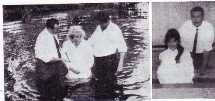
Baptêmes par MADOU. Actuellement, une trentaine de Tziganes et voyageurs sont baptisés