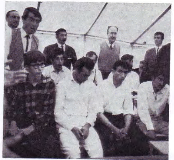
Baptêmes de Tziganes français, belges, hollandais et d'un « beatnik », à gauche, converti parmi les Tziganes

breux Belges vinrent de la ville de Bruxelles pour entendre l'Evangile sous le chapiteau.