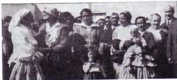
Chrétiens Tziganes Finlandais