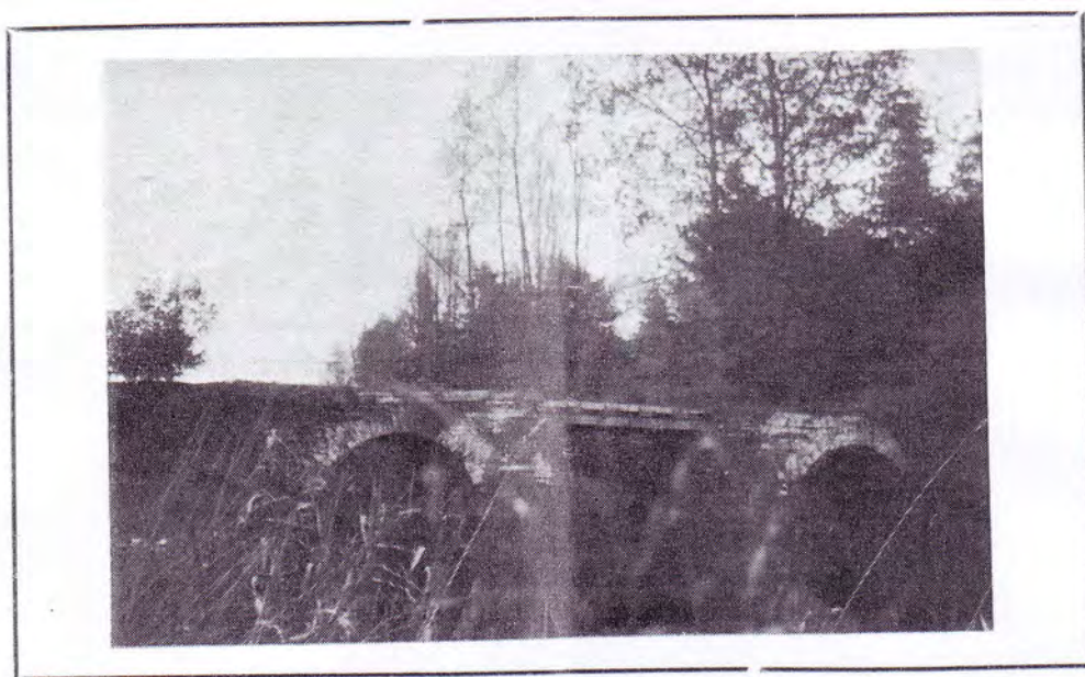
« Ce qu'on peut connaître de Dieu est manifeste pour les hommes... dans ses ouvrages » Romains 1 : 19-20

Leur Foi peut encore se reposer non sur la sagesse des hommes, mais « sur la puissance de Dieu » 1 Cor. 2 : 5.