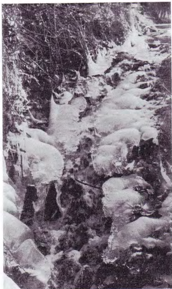
« La nature parle de la Sagesse et de la Puissance de Dieu. Dieu ne peut pas être enfermé dans d'étroites définitions théologiques »

« is d'élucubrations, de savantes combinaisons de mots. ; révélation de Dieu, afin qu'il y ait :