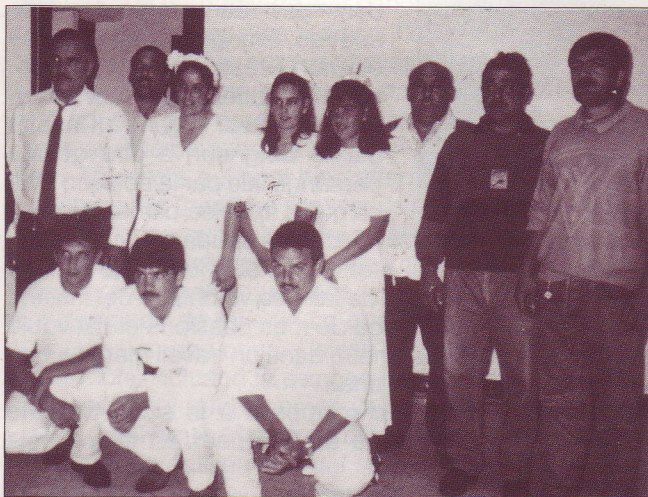
Les baptisés en blanc.