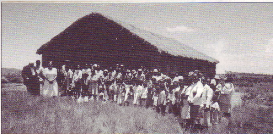
Maison d'Ambalandriana où débuta l'évangélisation du village.