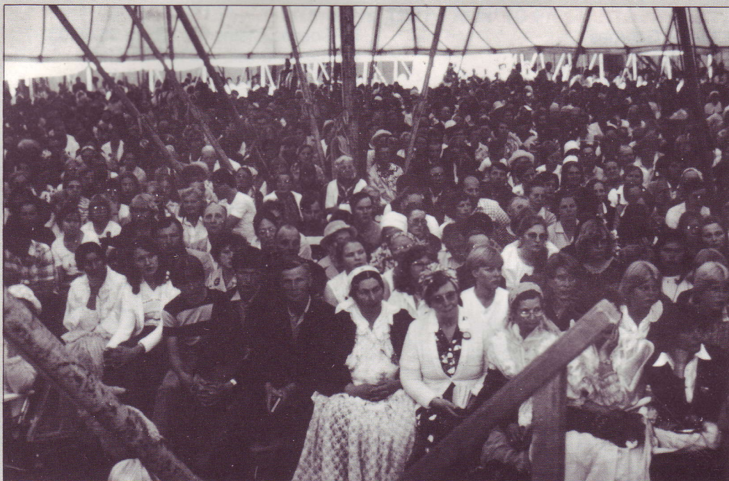
Partie de l'auditoire lors d'une Convention

Nous avons, l'an passé, lancé un S.O.S. en faveur des Pays de l'Est. Nous avons évalué la dépense de l'ordre de 500.000 Frs, à la fois pour les frais de déplacements, les missions d'évangélisation, et l'aide à nos frères des pays d'Europe de l'Est.