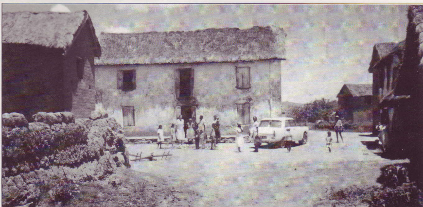
L'église du village d'Ambalandriana et les chrétiens.