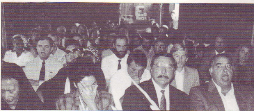
Inauguration de l'Eglise de St Macaire

L'inauguration de l'église de Saint-Macaire a eu lieu du vendredi 12 au Dimanche 14 février 1991. A cette occasion nous avons eu l'honneur d'avoir la visite de Monsieur le Maire de Saint-Macaire, celle du directeur de cabinet de Monsieur le Sous-Préfet, ainsi que celle de l'adjudant de gendarmerie.