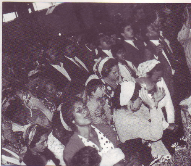
Moment de prière lors d'une convention des Roms

Les ROMS étant pauvres en prédicateurs, quelques frères de Belgique avec l'accord du président international, ont eu à cœur d'investir une grande partie de leurs économies pour l'acquisition de