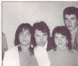
Quelques candidats au baptême