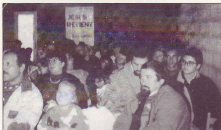
Réunion dans l'Eglise Tzigane de Bourges