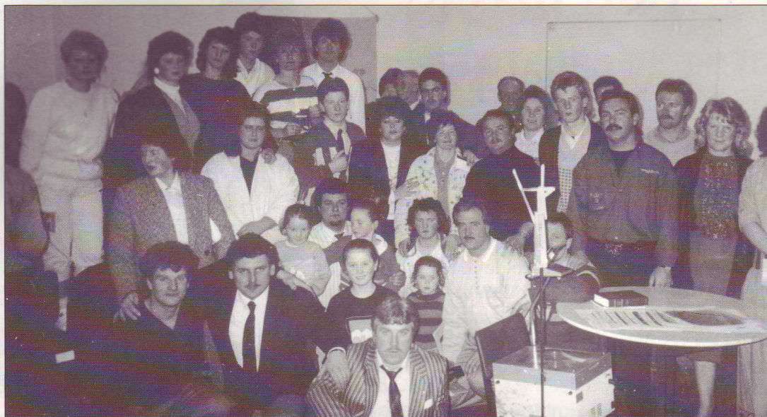
Groupe de Travellers irlandais avec les frères de France et d'Angleterre

Dans ce champ missionnaire récent et difficile, nous avons vu la main du Seigneur à l'œuvre. D'une part, nous avons pu, au cours de notre dernière mission du mois de mars, réaliser pour la première fois une rencontre de tous ceux qui se sont convertis dans l'île et les raffermir dans leur foi ; d'autre part, nous avons eu la joie d'annoncer l'Evangile à de nouvelles âmes. La moisson n'est pas terminée et nous prions le Seigneur de faire lever des ouvriers parmi ces groupes tziganes irlandais appelé «Travellers», c'est-à-dire «Voyageurs».