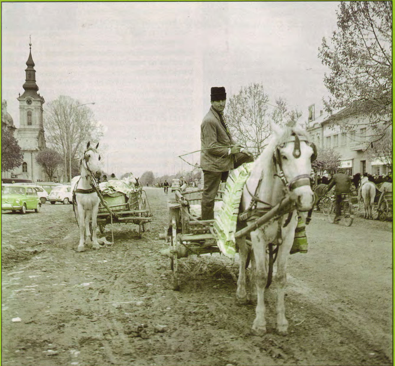
Village de Roumanie

N°126 - 1 er trimestre 1990 - le N°10 Fr