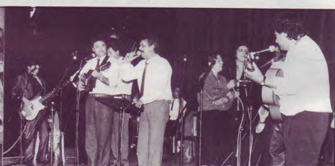
Anciens artistes gitans espagnols prêchant et chantant leur foi en Jésus.

Ces frères sont venus chanter leur foi et aussi nous annoncer la Bonne Parole de Dieu. Autrefois ils jouaient de la guitare et chantaient pour le monde. Ils étaient très connus en Espagne où ils passaient souvent à la télévision. Leur conversion a amené beaucoup de gitans à Christ en Espagne.