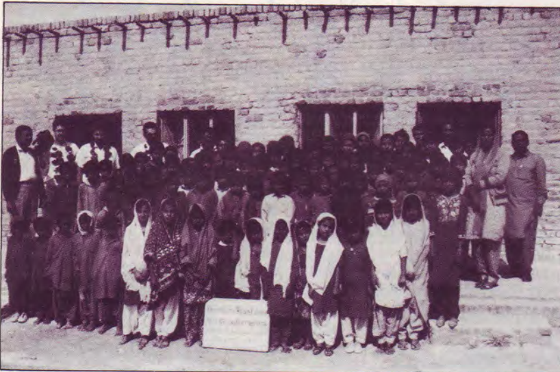
Notre école à Hyderabad