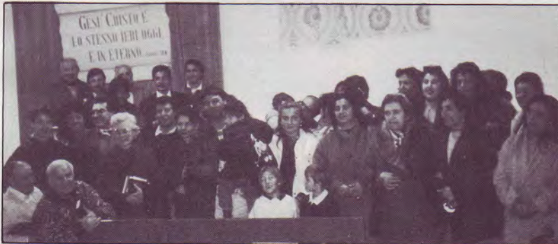
Eglise de PLATO (près de Florence)

Elle se tiendra près d'Amsterdam, au Port WESTELIJK HAVEN. Tous peuvent y venir à partir du 1 er août et camper sur l'emplacement prévu (pour 2000 caravanes) autour du grand chapiteau. On s'attend à une présence de 10.000 Hollandais. Toutes les églises de Hollande ont accepté de participer à cet effort de témoignage chrétien. Bienvenue aux Tziganes et à tous les lecteurs !