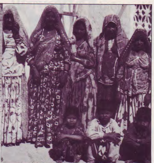
Femmes tziganes de la région du SIND

La «Pakistan Gypsy Mission Church» est le nom officiel de notre Mission Tzigane au Pakistan. Seize frères y travaillent à plein temps ; certains sont évangélistes, d'autres instituteurs. Ils contribuent à répandre l'Evangile dans toutes les grandes villes où il y a des gitans qui vivent dans des camps où les conditions sont misérables, dans une pauvreté extrême.