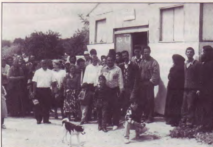
L'église de FARO et quelques chrétiens.