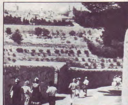
Pèlerins descendant du Mont des Oliviers, au fond Jérusalem et la Mosquée d'Omar.