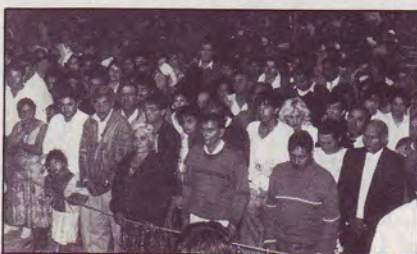
Lors de la Mission à Aix-les-Milles.