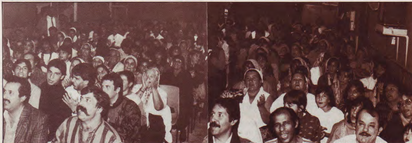
Partie de l'auditoire de l'église gitane de Marseille.