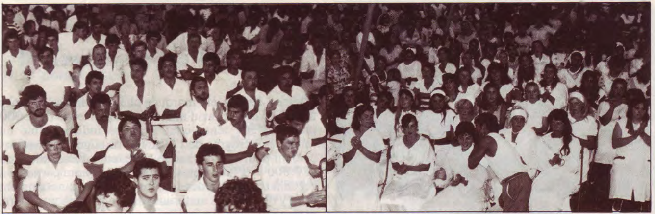
Quelques-uns des nouveaux baptisés.