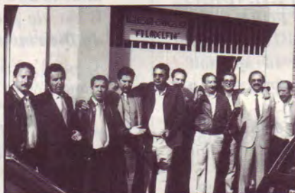
Frères du Conseil de Direction

150 personnes s'entassent sur une surface d'environ 70 m 2 . Pendant la prière les chrétiens s'expriment bruyamment comme dans les synagogues du quartier juif orthodoxe de Jérusalem.