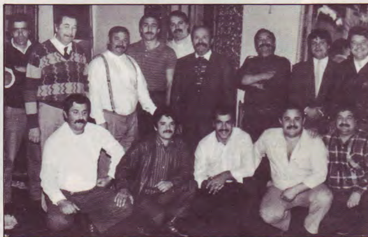
Quelques frères de l'Eglise de Tarbes