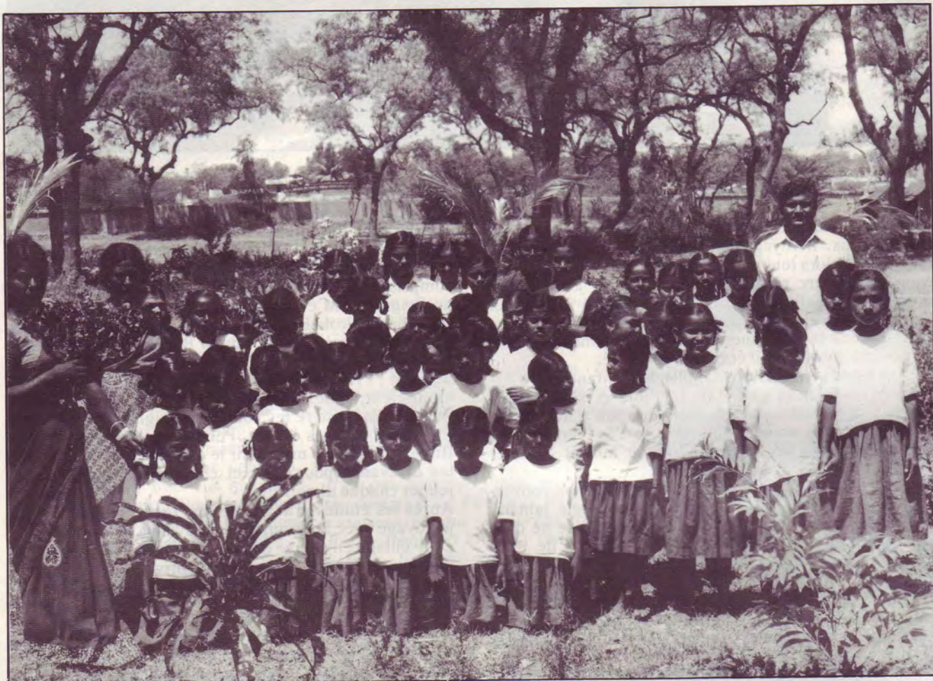
Enfants d'un pensionnat en Andhra Pradesh.

L'action d'évangélisation et l'action sociale continuent sans relâche dans ce vaste pays où vivent la moitié des tziganes du monde.