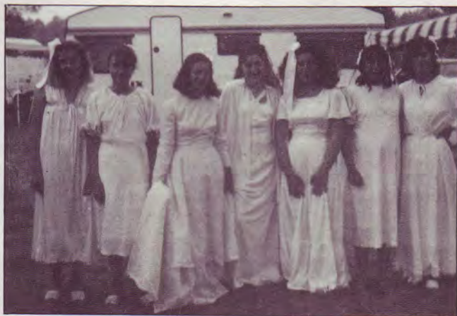
Les sœurs baptisées à Odans, près de Bordeaux