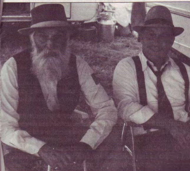
Berto et son père, deux hommes de foi.