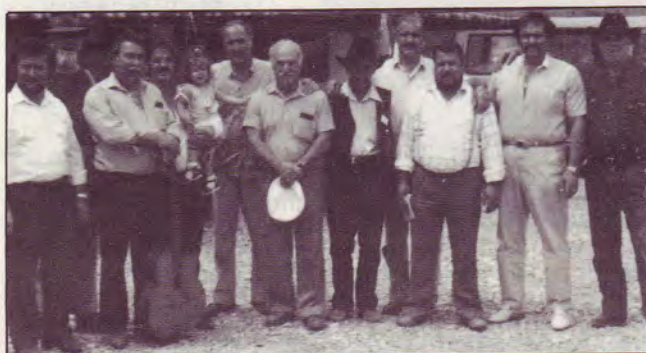
Quelques frères tziganes en Suisse

«Ce ne sont pas les Tziganes qui se sont adaptés à nous, mais nous à eux. Ce sont eux qui nous ont acceptés. Ce que les Tziganes nous apportent, c'est quelque chose que l'on recherche.»