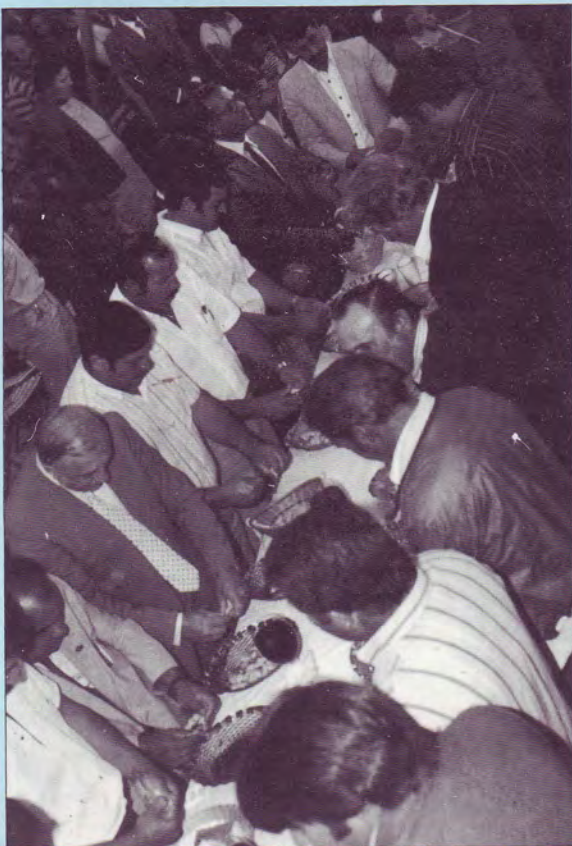
Préparation de la Sainte-Cène