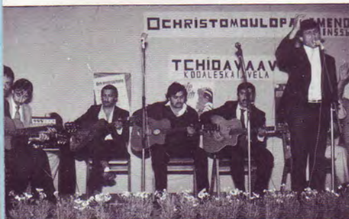
Chanteurs et guitaristes