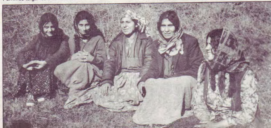
Femmes tziganes en Roumanie.

Nombreux sont les tziganes qui vivent dans les Pays à régime communiste. Parmi eux il y a des frères et des sœurs tziganes. Nous avons entrepris des actions missionnaires en Pologne où il y a eu quelques baptêmes, en Hongrie où il y a actuellement un nouveau début de réveil, en Roumanie où plusieurs frères qui furent persécutés ont dû s'enfuir et se réfugier aux USA, en Bulgarie et en Yougoslavie. C'est un vaste champ missionnaire sans compter la Russie où il y a aussi quelques chrétiens tziganes. On estime à plus de 10 Millions les tziganes vivant dans ces pays. C'est l'un de nos grands objectifs d'aller davantage vers nos frères des Pays de l'Est.