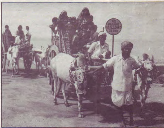
La caravane de chars à bœufs conduits par les Tziganes Lambadis que nous avons rencontrés.