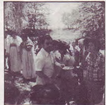
...et distribuant la communion.