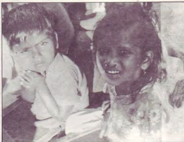
Enfants tziganes indiens

LE 21/3 : Nous visitons la Maison «A» de Pudukkudi. Tout près se trouvent deux colonies de tziganes de la tribu des Narikoravas. Nous avons constaté les dégâts causés par un ouragan : toitures enlevées, barrière détruite. Nous avons là une réunion de prières avec les serveurs de Dieu du Tamil Nadu pour l'examen des problèmes et besoins de son œuvre.