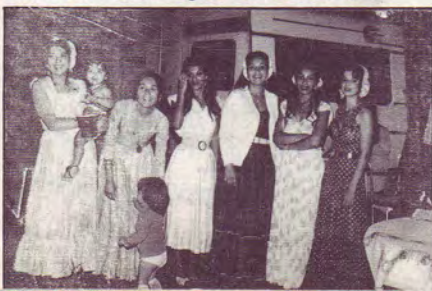
Sœurs en Christ de l'Eglise Rom de Stockholm

l'Evangile à un groupe d'enfants tziganes.