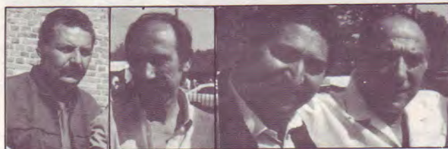
Jaime DIAZ Président Espagne

Aujourd'hui le fruit d'un travail missionnaire persévérant est là, témoignant de la bonté et de la puissance de Dieu. Près de 30.000 gitans ont cru en Jésus et se sont fait baptiser. Près de 1.000 prédicateurs évangélisent leur peuple et les Espagnols. Grâce à une aide des Eglises de Pentecôte de Norvège s'élevant à 10 Millions de pesetas (600.000 Frs), un Centre de Formation Biblique est en construction aux environs de Madrid. Ce centre aura une capacité de 800 lits pour y recevoir les prédicateurs lors des retraites spirituelles. Chaque chrétien participe également à la réalisation de ce Centre, les églises ont en effet décidé que chacun doit donner 10 pesetas par jour (0,60 Fr). Cette offrande spéciale est collectée lors des réunions qui ont lieu chaque jour.