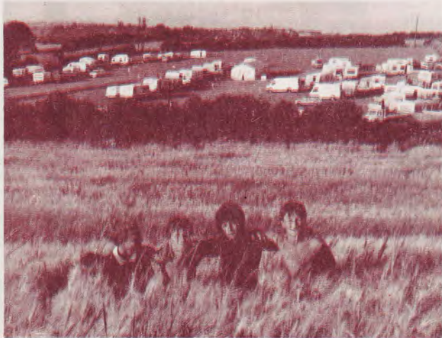
Première convention, près de Nottingham

Depuis je me suis engagé à servir le Seigneur et j'annonce à mon tour l'Evangile à mon peuple en Grande-Bretagne. Mon épouse Nora s'est aussi convertie et, ensemble, nous servons le Seigneur avec joie.