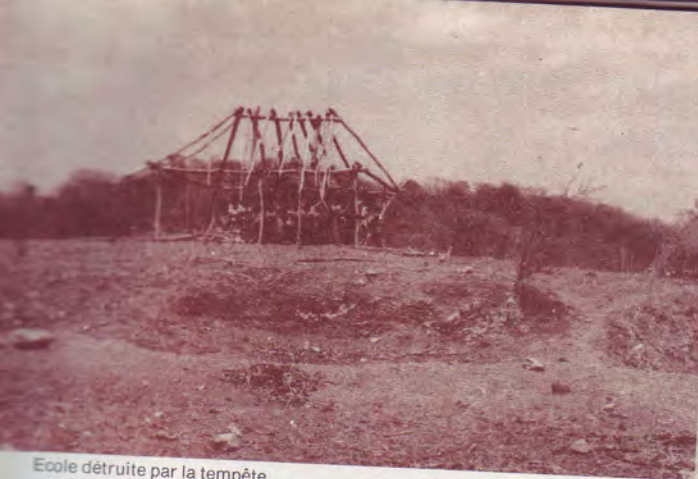
Ecole détruite par la tempête