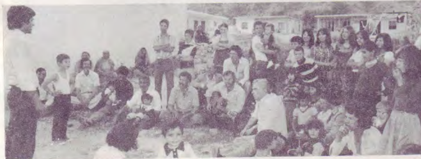
Baba prêchant aux Roms, vers la frontière turque

Le jour est enfin venu où Jésus a exaucé ma prière. Mon mari appartient au Seigneur depuis deux ans. Nous sommes très heureux d'être sauvés tous les deux et le bonheur est entré dans notre foyer.