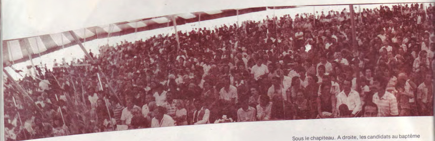
Sous le chapiteau. A droite, les candidats au baptême