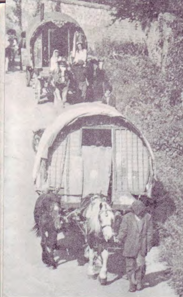
Caravanes de Tziganes anglais

Les prédicateurs venus de France participer à cette première convention ont été un grand sujet d'encouragement pour nos frères anglais. Il y avait : Talis, Félix, Pierrot, Freddy, Pellette, Djimy et Dufour qui fut l'interprète.