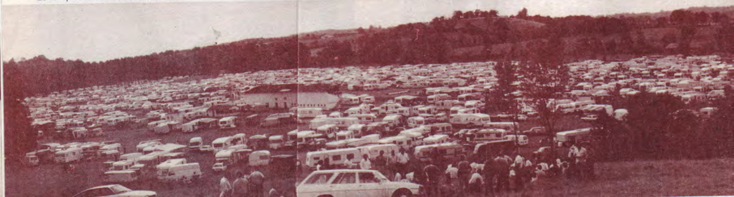
Le campement autour du chapiteau