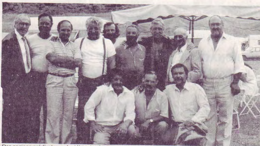
Des anciens prédicateurs du début du réveil se sont retrouvés à la Convention

PROCHAINE CONVENTION 27 - 31 MAI 84 à ENNORDRES (Cher)