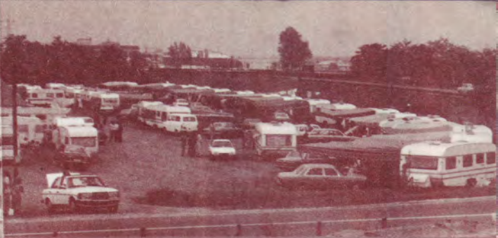
Musiciens Roms et Man-ouches français (Gagar), allemands et italiens