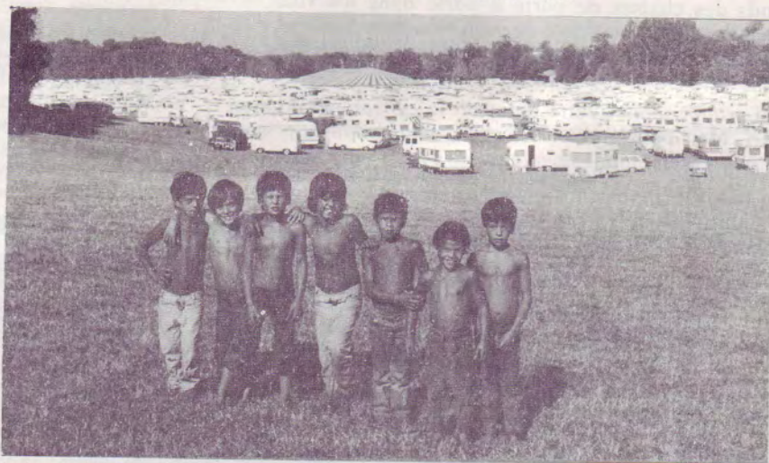
La future génération pose le problème de la jeunesse