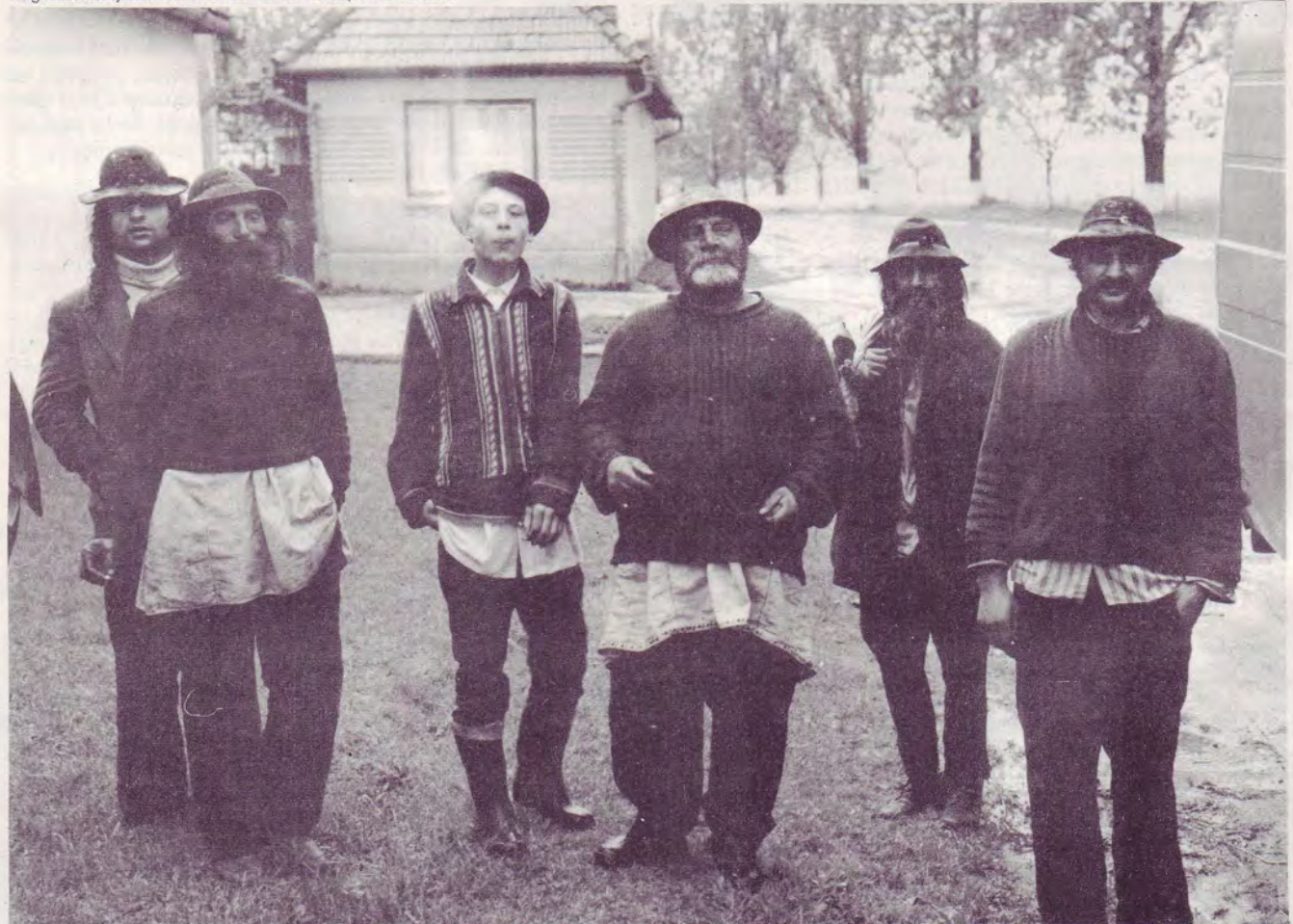
Tziganes d'aujourd'hui en Roumanie - Groupe Kalderash.