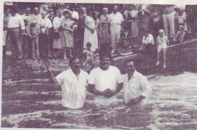
Baptêmes de Man-ouches en Allemagne, à Pforzheim.

- «Ta lettre m'a donné du courage en lisant que vous pensez à moi dans vos prières... J'ai un nouveau avec moi mais non-croyant. Je vais voir si je peux le faire croire en Dieu...»