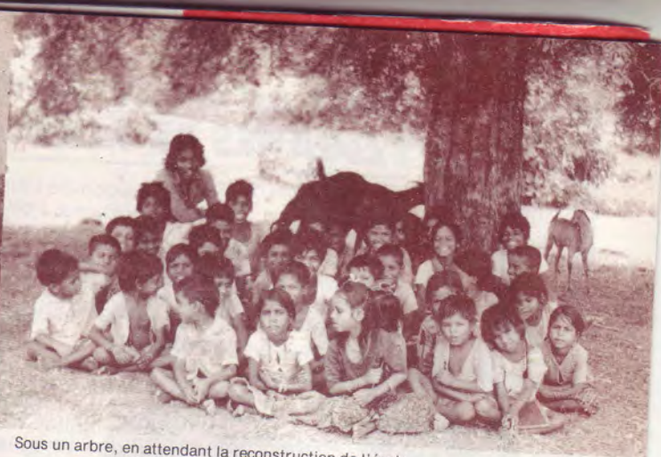
Sous un arbre, en attendant la reconstruction de l'école