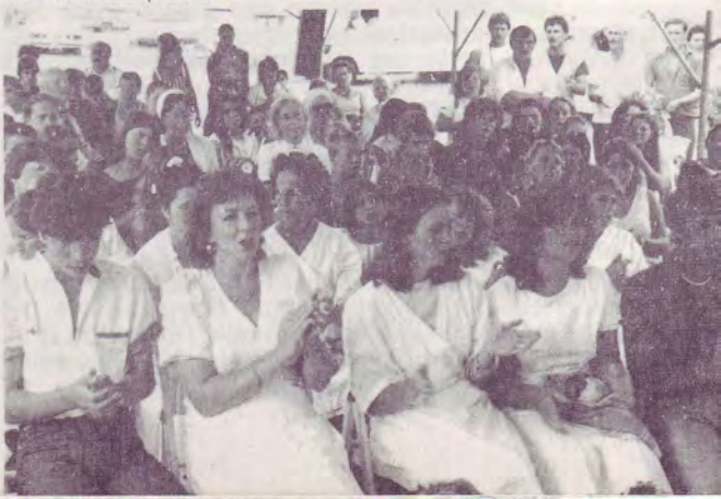
Candidats au baptême.