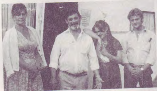
Savé et sa famille

Je sais que le Seigneur est vivant car il écoute et exauce nos prières.