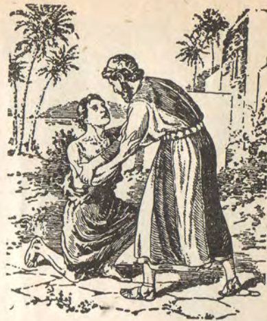
Repentance du Fils prodigue

La repentance n'est pas LA CONVICTION DU PECHE. Il n'est pas suffisant d'être convaincu de péché. La conviction de péché est UN ELEMENT DE LA REPENTANCE, mais vous pouvez être convaincu de péché sans pour cela vous repentir. Personne ne