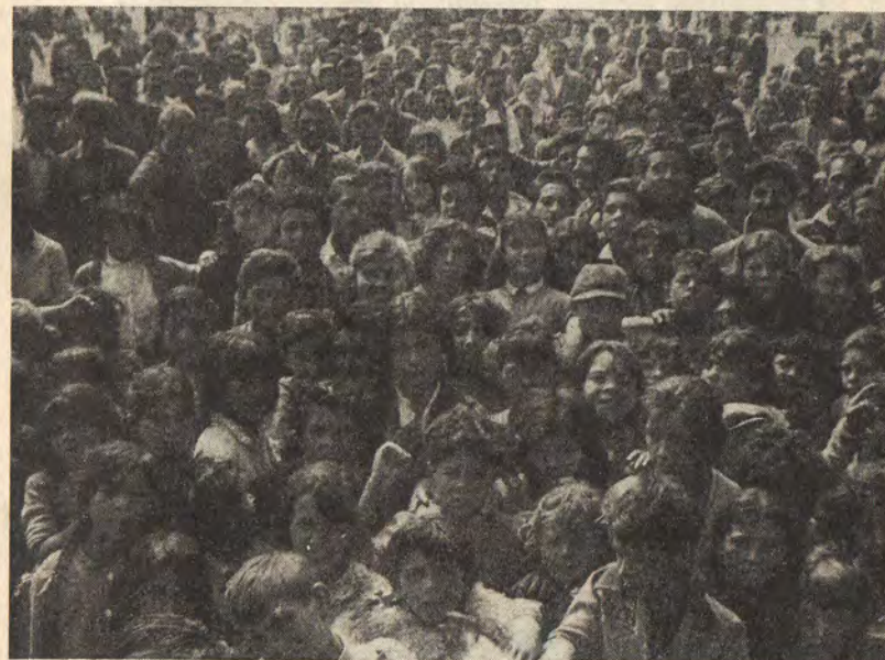
Quelques jeunes Tziganes, lors d'un Rassemblement National.

Il m'est impossible de relater en détails tous les faits multiples d'un campement si mouvementé et si plein de diversité. Pour cela il me faudrait un gros volume. Je désire simplement faire revivre aux lecteurs de Lumière du Monde quelques détails qui échappent à celui qui vient de l'extérieur comme spectateur, tout en donnant un rapide aperçu des bénédictions reçues de la part de Dieu. Je laisse sous silence nos luttes, nos peines, nos soucis, nos larmes... cela fait partie de l'arrière-plan que Dieu connaît.