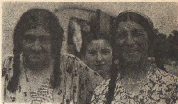
Femmes Tziganes de la tribu des Roms.