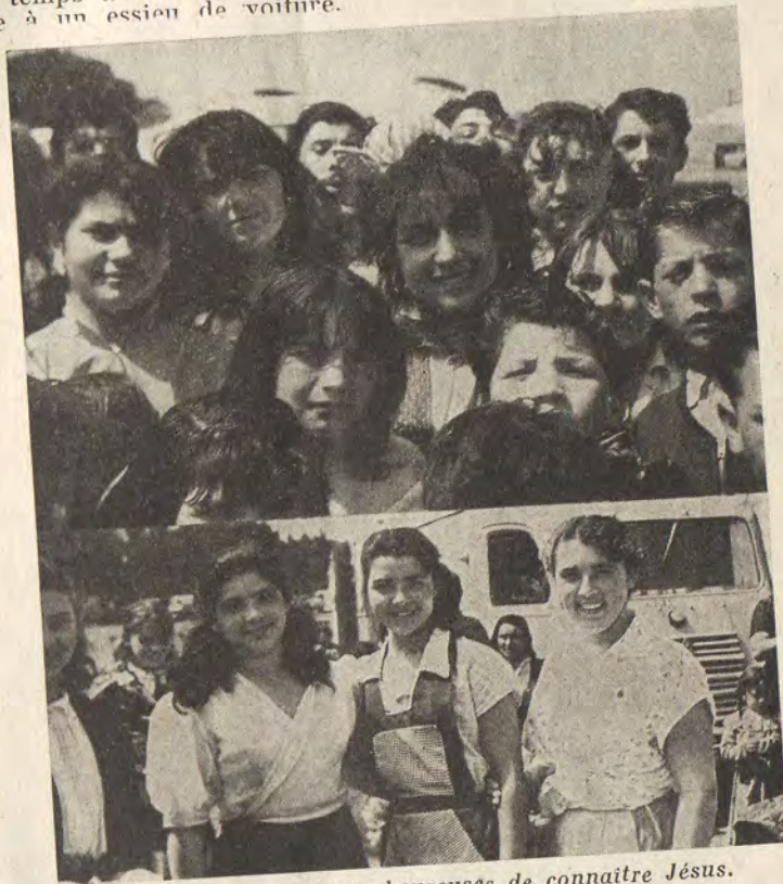
Jeunes filles Tziganes, heureuses de connaître Jésus.

vous entendez le cri des hiboux dans le bois et aussi les grenouilles de l'étang qui coassent. Au lever du soleil ce sont les chants des coqs attachés par la patte aux roulottes. Il y a même un « cochon » venu lui aussi en « roulotte » qui se met à grogner. Les chevaux « tziganes », attachés par de grosses cordes, hennissent dans le pré voisin. Quant aux chiens, il y en a partout... au moins un sous chaque caravane, et tôt ils se bagarrent en poussant des aboiements colériques. A tout cela vous pouvez ajouter ici un singe qui distrait quelques enfants par ses pirouettes sur le capot d'une voiture, là une pie apprivoisée, qui de temps à autre jacasse, parce que elle aussi est attachée par la patte à un essieu de voiture.