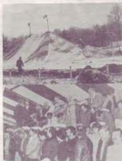
Consécration des ouvriers

Cet accident va coûter 20 000 NF s'ajoutant aux 65 000 NF qu'il fallut dépenser quelques jours avant pour acheter de nouveaux câbles et des éclairages batteries en supplément aux nouvelles lampes, pour répondre aux normes de sécurité. Cette dépense imprévue grève notre budget et nous faisons appel à nos amis afin qu'ils viennent à notre secours dans la mesure de leurs possibilités afin que notre action missionnaire qui se continue malgré les difficultés créées par la nouvelle loi sur le change, ne soit pas entravée. Merci à tous ceux qui ne nous abandonnent pas à l'heure de l'épreuve.