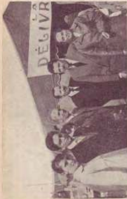
M. Gaspot et M me (à droite) avec quelques collaborateurs devant la tente d'inauguration