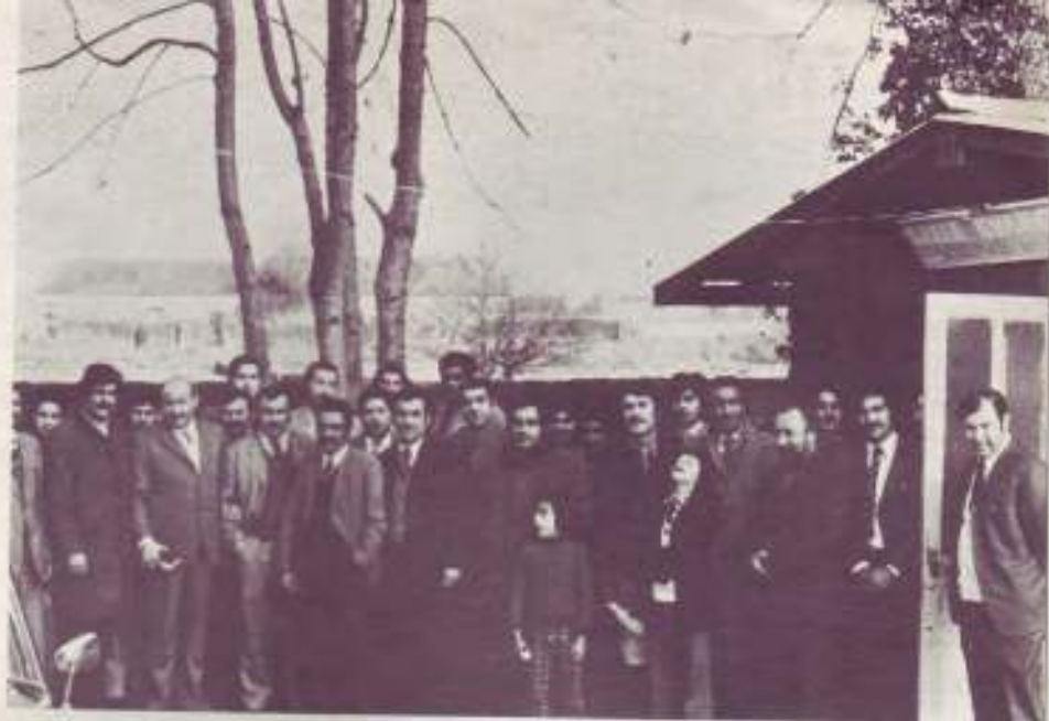
A gauche le prédicateur GARÇONNET qui a prêché dans les églises catholiques

Il se passe aujourd'hui des événements pour le moins surprenant. Vous avez sans doute lu les « Documents Expériences » qui vous relatent des faits réels concernant le Mouvement charismatique chez les catholiques pentecôtistes, et voici qu'en France il y a aussi des choses bouleversantes.