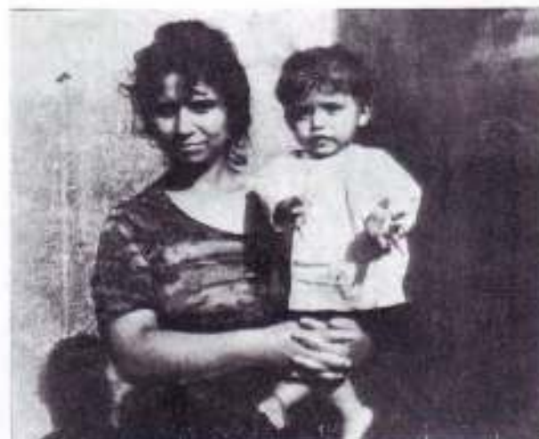
Enfant de 18 mois atteint de pleurésie et guéri par le Seigneur à Perpignan, au mois de novembre.

UNE GRANDE CONVENTION NATIONALE POUR UNE NOUVELLE OFFENSIVE D'ÉVANGÉLISATION PARMIS LES GITANS DU MIDI DE LA FRANCE AURA LIEU DU 10 AU 12 MARS, A CAZER, AU NORD DE TOULOUSE.