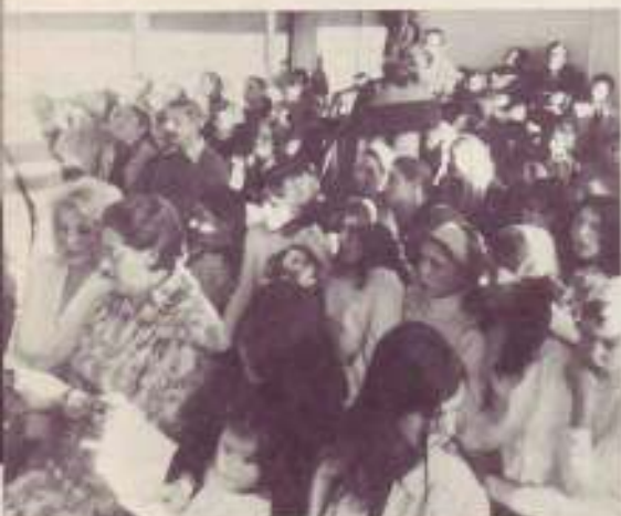
partie de l'auditoire