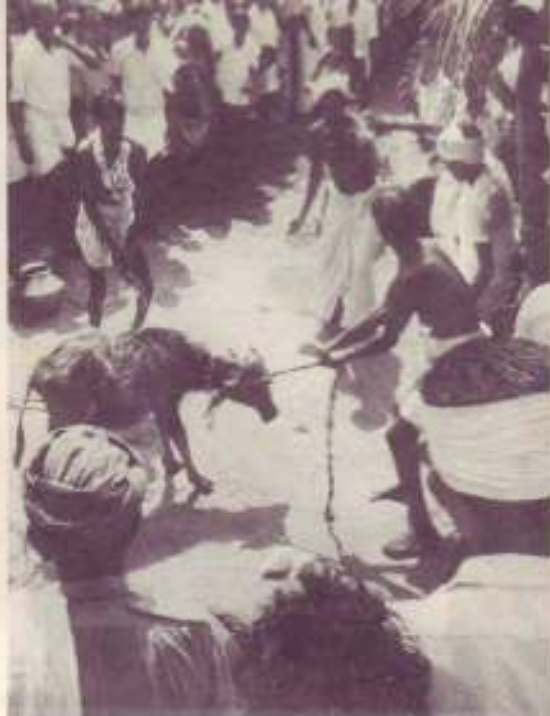
Photo : Sacrifice d'un buffle au " dieu " hindou, telle est l'une des pratiques des tziganes païens qui ne connaissent pas Jésus-Christ. Notre devoir est de leur annoncer la " bonne nouvelle ". Pour cela nous sautonnons régulièrement 12 prédicateurs en Inde, par votre participation à cette œuvre missionnaire.