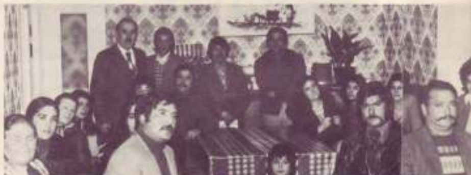
Réunion au Mans