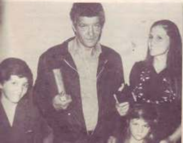
Moment de louange avec les gitans de Buenos-Aires